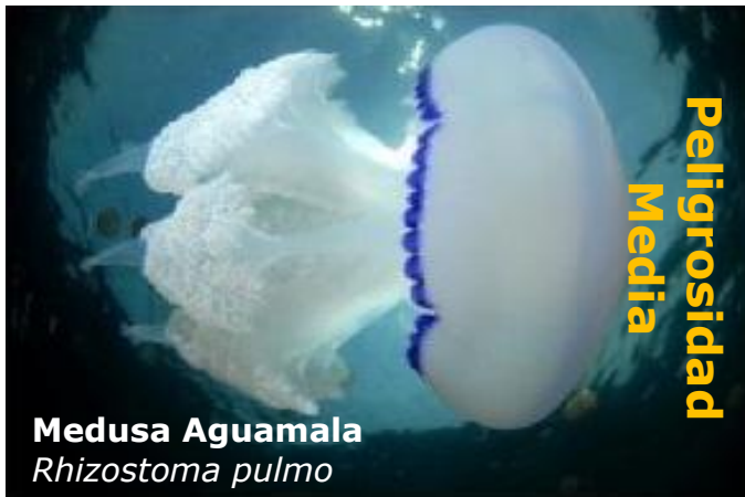
Medusa Aguamala Rhizostoma pulmo