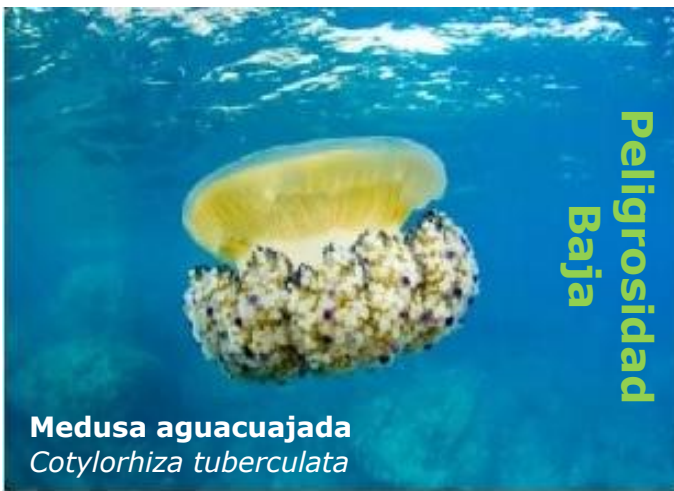
Medusa aguacajada Cotylorhiza tuberculata