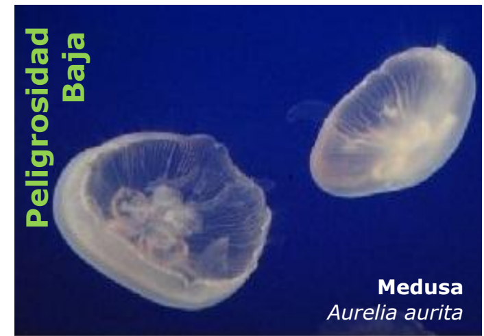
Medusa Aurelia aurita