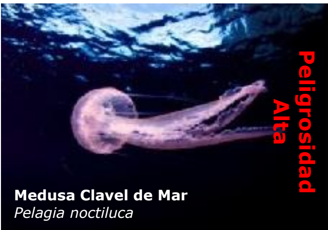
Medusa Clavel de Mar Pelagia noctiluca