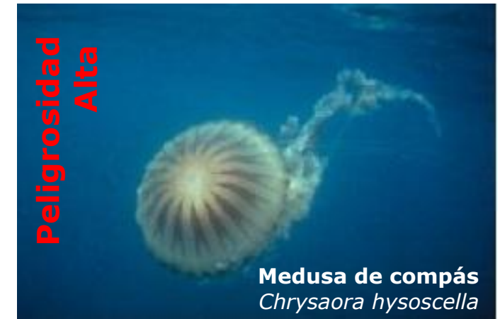
Medusa de compás Chrysaora hysoscella